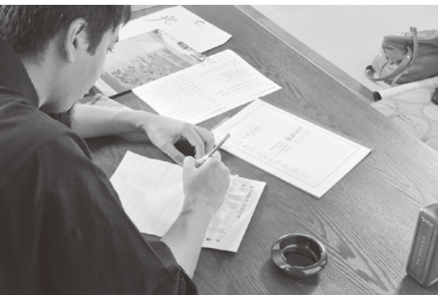
写経は心の安らぎを与えてくれます

字が下手だからとか、難しい字はちょっと書けないとか、そんな心配は全くいりません。書道の経験も一切いりません。写経の初めは、なぞり書きからです。薄く印刷された文字の上を、なぞり書きするだけで写経が始められます。お好きな時間にあなたの好みのペースでできます。筆ペン1本あれば、自宅でも簡単に始められますので、自分の時間を大切にできます。自宅であれば、家族で写経をなされるのも良いと思います。コンパクトなノートサイズなので1枚ずつはずして書けます。